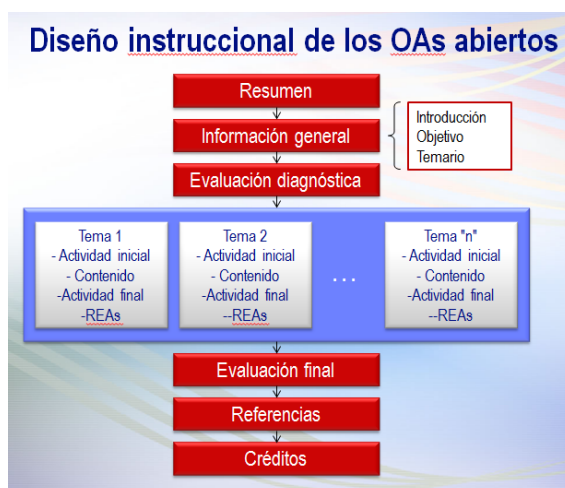
Figura 1. Diseño instruccional de los OAs abiertos.

La presente ponencia se refiere a este tercer objetivo. Concretamente, a través de un proceso de intervención, se pretende formar a un conjunto de profesores mediante el empleo de diversos objetos de aprendizaje abiertos que sean ofrecidos a través de tecnologías computacionales y de Internet. Los objetos de aprendizaje abiertos están siendo desarrollados por diversos sujetos: expertos en contenido, diseñador instruccional, programadores web e investigadores del proyecto (en forma transversal en cada etapa). La estructura del diseño instruccional en los OAs contempla el desarrollo de una competencia a través de evaluaciones, contenido, actividades interactivas, evaluaciones y REAs (Figura 1).