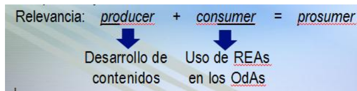
Figura 4. Relevancia del estudio para el Movimiento educativo Abierto