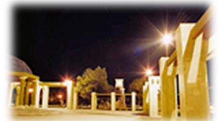
Parroquia de San Francisco de Asís