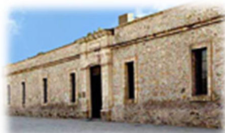
Museos de Monclova