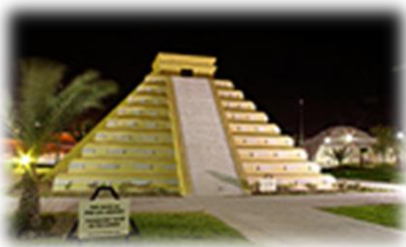
Plaza de las culturas