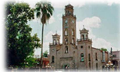
Museos de Monclova