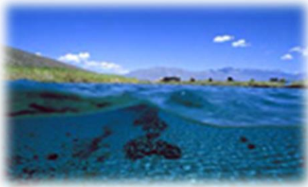
Valle de Cuatro Ciénegas