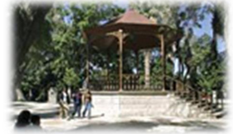
Macro plaza en Piedras Negras