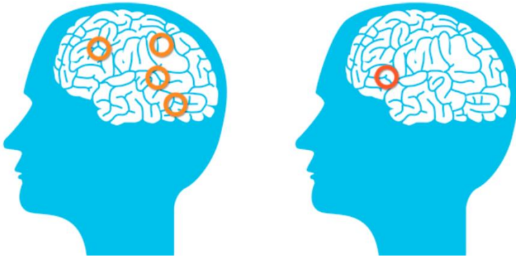
Anexo 1. Diferencia cerebral entre un lector normal y uno con dislexia