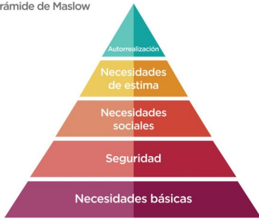
Pirámide de Maslow