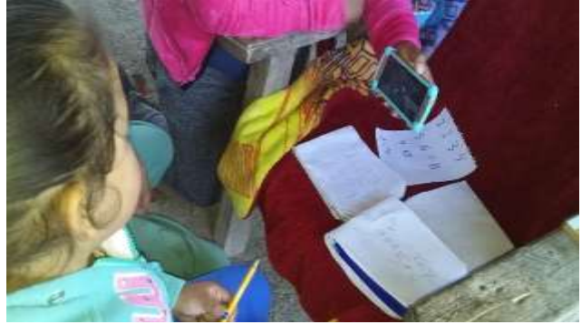
Anexo 8, p. 20. Traslado a la comunidad para la sorpresa navideña de los alumnos.