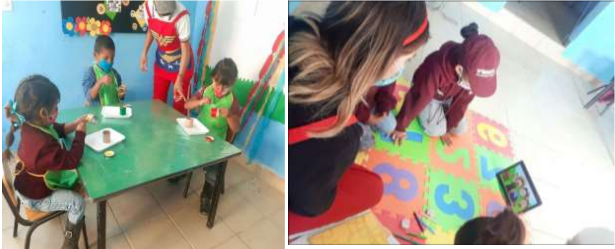
Anexo 14, p.31. Redecoración de las instalaciones para el trabajo semipresencial.