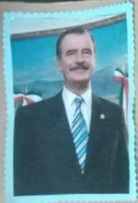
vicente FOX Quesada

El ejecutivo federal determinarán los planes y programas de estudio de la educación preescolar, primaria y secundaria.