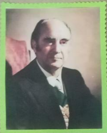
José López Portillo y Pacheco

Las universidades e instituciones de educación superior tendrán poder de governarse a sí mismas.