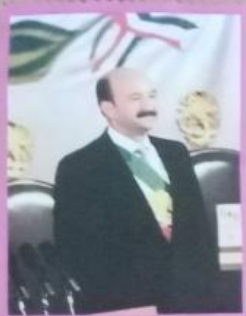
CARLOS Salinas de Gortari.

1993 Se impartirá educación preescolar, primaria y secundaria son obligatorias. La educación será democrática y el estado atenderá todos los tipos y modalidades educativos.