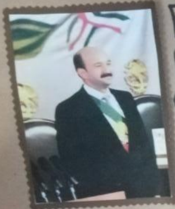
Carlos Salinas de Gortari.

El aprecio para la dignidad de la persona y la integridad de la familia.