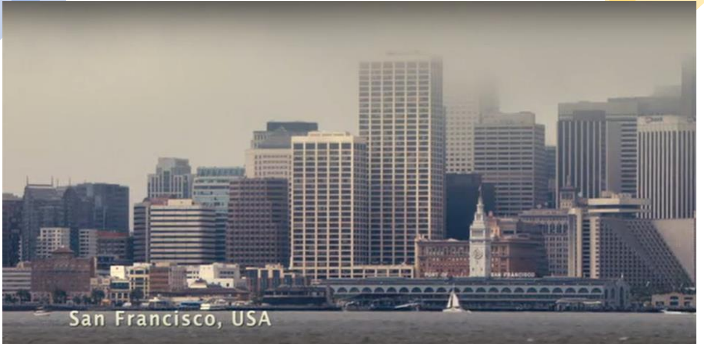
San Francisco, USA