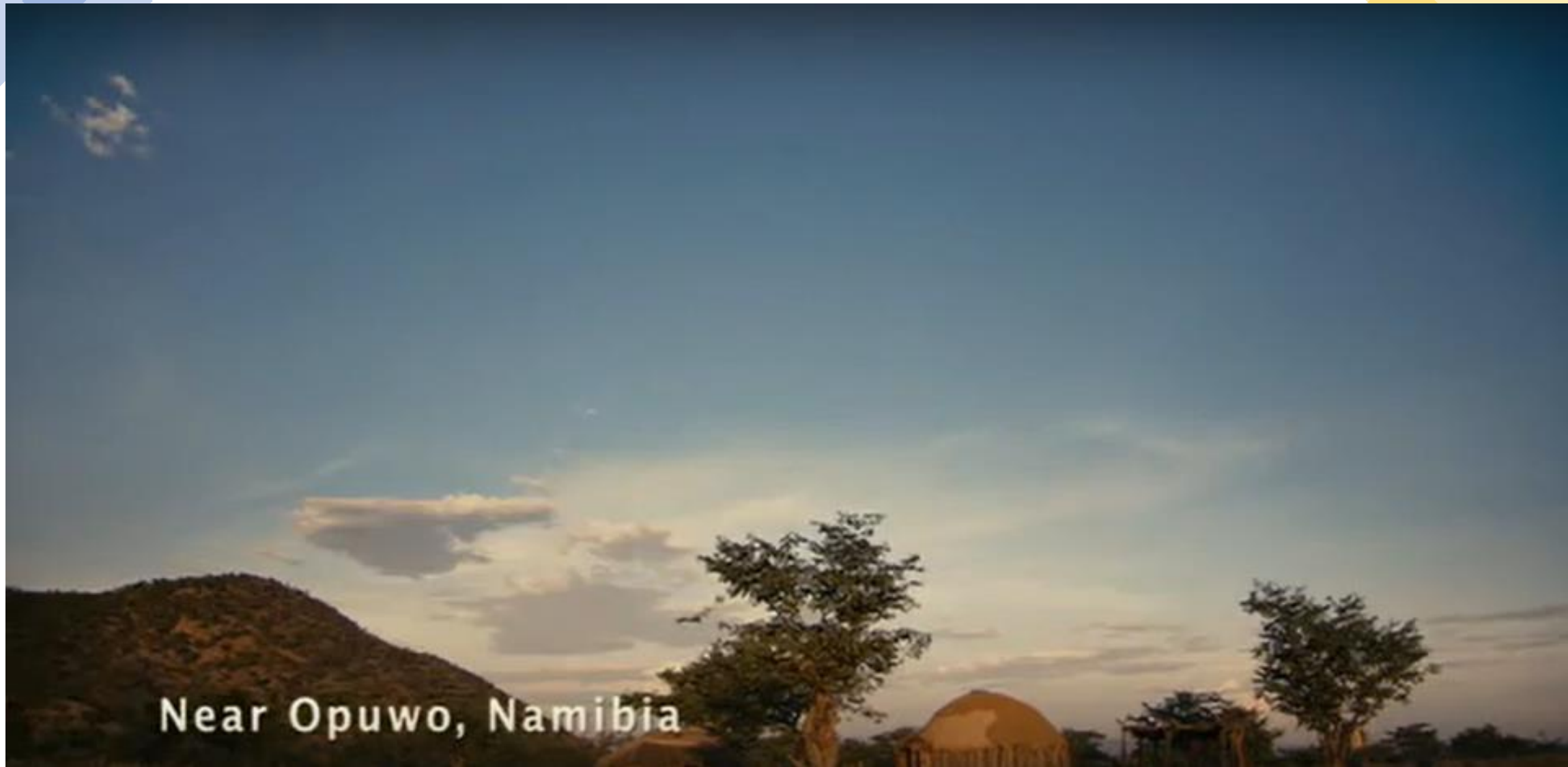
Near Opuwo, Namibia