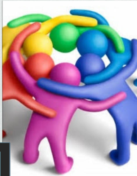
Equipos de clase