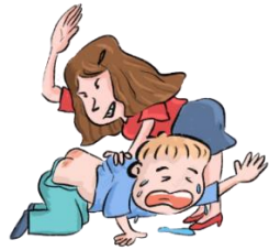
Que me peguen