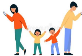
Que me ignoren