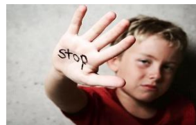
Que no respeten cuando digo "No"