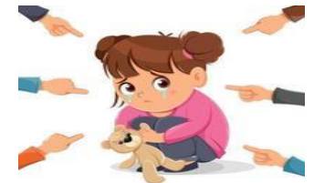
Que me hagan sentir mal de mí mismo