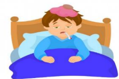
Que no me cuiden cuando estoy enfermo