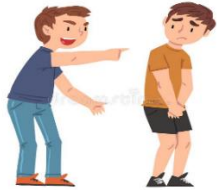
Que se burlen de mi