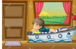
Que me dejen solo en casa