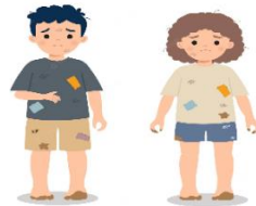
Que no me bañen