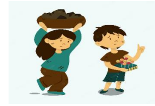
Que me obliguen a trabajar