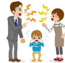
Escuchar a mis papás pelear