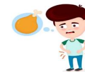
Que no me den de comer