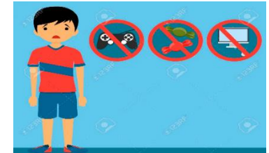
Que no me dejen jugar