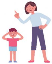
Que me insulten