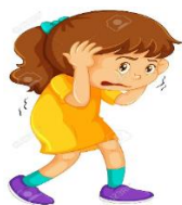
Que me haga sentir miedo