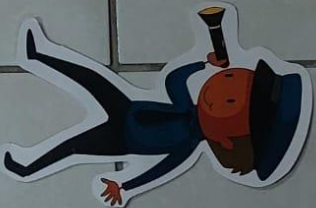
Guardia de Seguridad